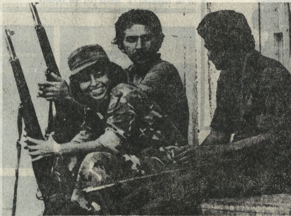
В ОБЪЕКТИВЕ — НИКАРАГУА НА СНИМКЕ: никарагуанская молодежь.