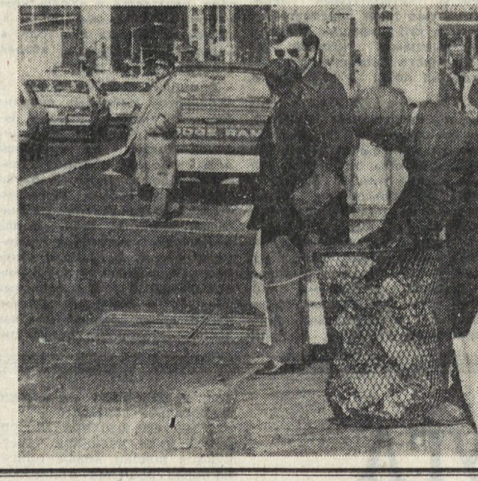
В баре «Большой Дэн» в Нью-Бедфорде, штат Массачусетс, произошла изнасилование посетителя на глазах у посетителя.

внимание на «маленькое происшествие», случайно совпавшее во времени с их ритуальным визитом в обитель всеобщей жизни. А происходило вот что. Девушку привлекли к стойке бара и изнасиловали на глазах у посетителя. Под лотком «Большого Дэна», как и положено в подобных заведениях, работал телевизор. На экране шел XX век. Там готовился к запуску очередной «Шаттл». Президент говорил