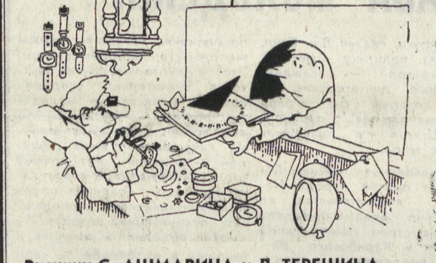
Рисунки С. АШМАРИНА и Л. ТЕРЕШИНА.

Продлись, весна! Дыши еще, Небесной каплею сорвется, Дари сумятицу, обветренные журчи... упадет И — год к яному повернется круто. Я так боюсь, что высохнут Губы, Гори, душа! И петух, И пень голый, петух, Пои, как блаженный, И смолкнет жизнь. И все полетит на убыль. Скажи, как дождь, И горло, как ручей, И как мала-апрельская не пересохло. Светлана ТАРХАНОВА