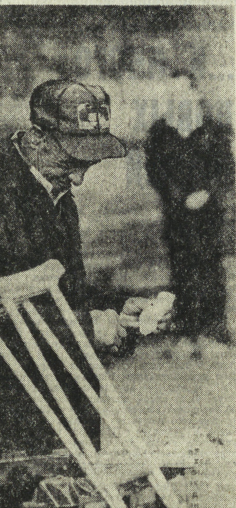
США. Второй год в национальный праздник «День благодарения» выстраиваются в длинную очередь рядом с Белым домом за бесплатной похлебной безработице, бездомные. Женщины и мужчины, дети и старики, белые и черные — всех их привлекла сюда одна беда — голод и нужда. У этих людей не осталось ни надежды, ни гордости. Такую картину (на снимке) можно было наблюдать в этот день и во многих других уголках Соединенных Штатов, где бедность, безработица, нищета достигли беспрецедентного за последние полвека уровня. Однако нынешний хозяин Белого дома, как отметили местная печать, не увидел несчастных и обездоленных американцев. Он в это время роскошествовал на своем ранчо в Калифорнии.