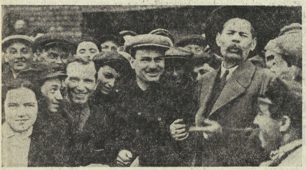
ДАЛЕКОЕ — БЛИЗКОЕ

Через несколько дней, 28 марта отмечается 115 лет со дня рождения Александра Максимовича Горького. Пародем революционных идей проминуты доктрисские произведения Горького, самое известное из которых — роман «Мать» воспринято было как поэма о новых терлах истории. В них глас послонатабных лет он славил, раскрепощенную созидательную силу людей, историческое творчество свободного народа, гордые могучество освобожденного труда.