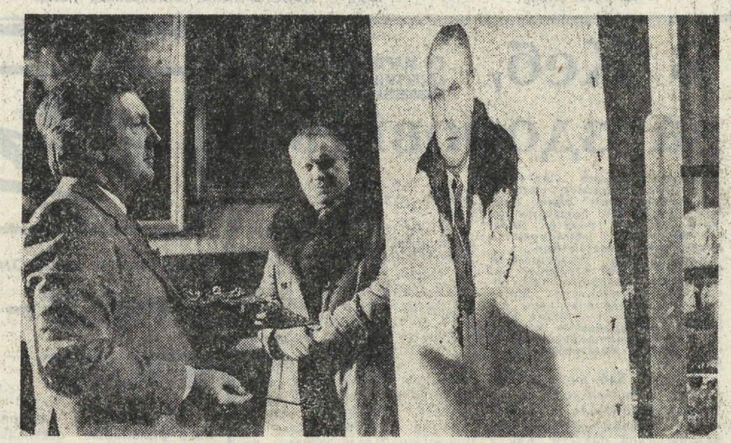
МОСКВА. Народный художник СССР Илья Глазунов успешно продолжает работу над циклом портретов «Наш современник». Портреты этого цикла, которые запечатлели черты людей нашего времени и молодых, и юных — государственных деятелей и простых рабочих, артистов и строителей БАМ, знаменитых и совсем неизвестных, неоднократно экспонировались на выставках. НА СНИМКЕ: Илья Глазунов пишет портрет писателя Владимира Солоухина.