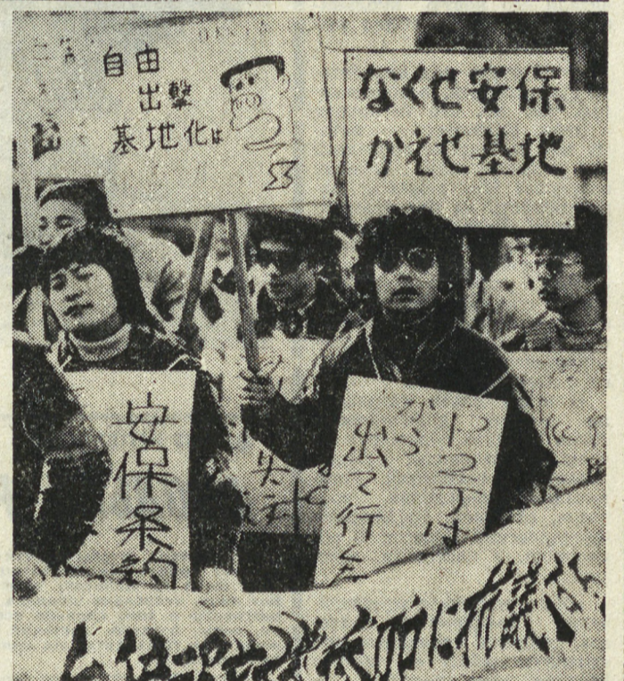
В Японии нарастает движение протеста против усиления милитаристских приготовлений в стране и укрпления японско-американского военного альянса. Во многих городах проходят демонстрации и митинги (на снимке). Прогрессивная общественность резко осуждает участие кораблей японских «сил самообороны» в крупномасштабных учениях в зоне Тихого океана «Рингайт-80» совместно с ВМС США в Австралии и Новой Зеландии.