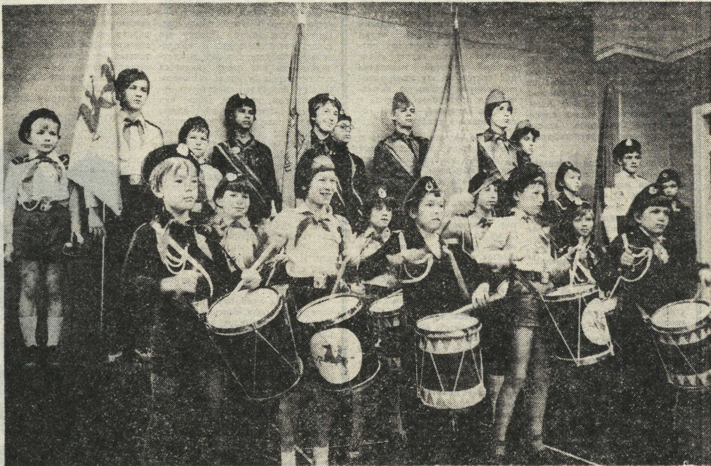
МАРШРУТАМИ ПИОНЕРСКОГО МАРША