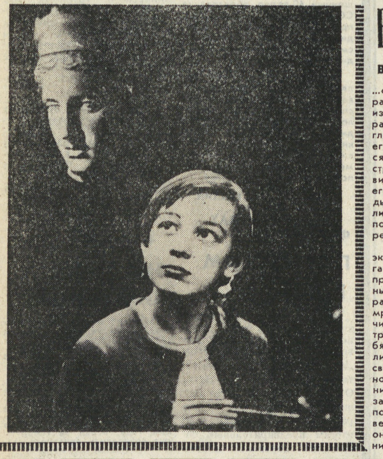
Рис. С. НИКИТИНА.

Красивый новогодний праздник принес, к сожалению, не только радость. Прежде всего обществу поступают на центральный пункт пожарной связи. Причиной многих пожаров явилось нарушение правил пожарной безопасности при эксплуатации елочных гирлянд.