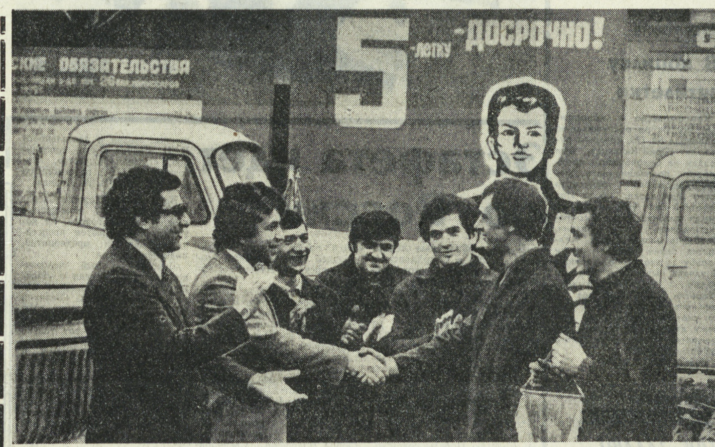
УРОКИ ПЕРВОЙ ПРАКТИКИ