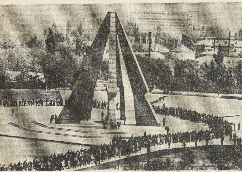
ПО СТОЛИЦАМ СОЮЗНЫХ РЕСПУБЛИК