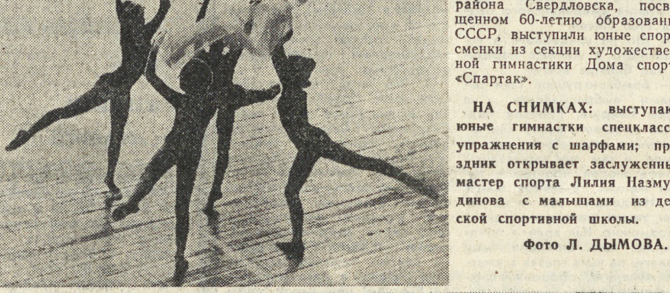
НА СНИМКАХ: выступают юные гимнастки спецкласса; упражнения с шарфами; праздник открывает заслуженный мастер спорта Лилия Назмутдинова с малышами из детской спортивной школы.