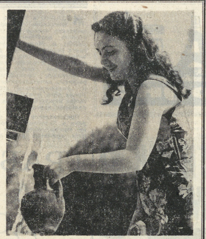
Грузинская ССР. Из этого источника пил воду Александр Пушкин, когда путешествовал по Военно-Грузинской дороге.

Часто хозяйки сетуют на то, что не успевают после работы в парикмахерскую, в магазин, в химчистку, а в выходные хочется отдохнуть, меньше думать о домашнем хозяйстве.