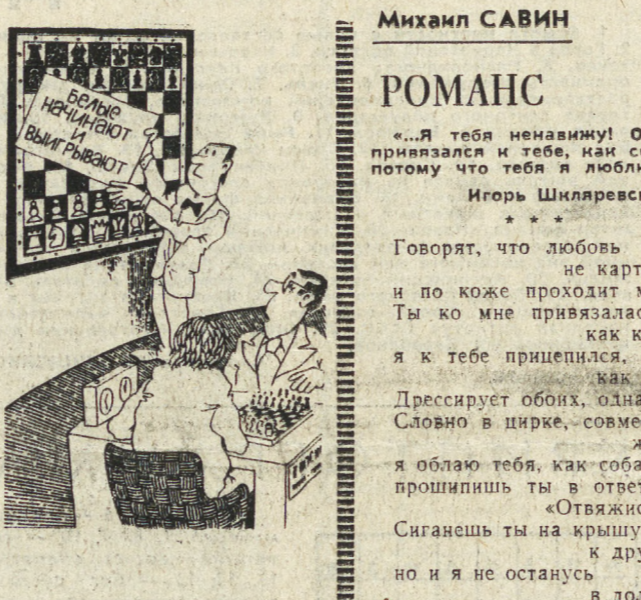
Рис. С. АШМАРИНА.

А вот еще одно место, где некогда высился старинный храм. Чтобы его убрать, по надобности несколько центральных димитов. Говорят, раньше раствор замешивали на яичках и молоке, поэтому он приобретал особую твердость. Сейчас на этом месте вы видите, впрочем, мы ничего не видим, потому что на этом месте ничего нет. Извиняюсь, на этом месте вы