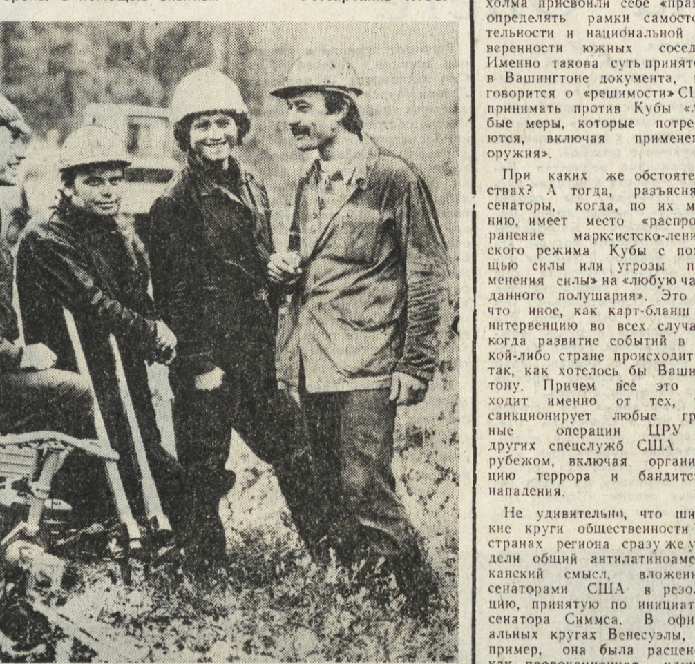
ВЫГРЫШЕ И СОВЕТСКАЯ СТОРОНА. С ПОМОЩЬЮ ОПЫТНЫХ

ки и строительство своей рабочей силой. Распределение заготовленной древесины — в соответствии с вложенным трудом, средствами и материальной долей древесины идет советским потребителям.