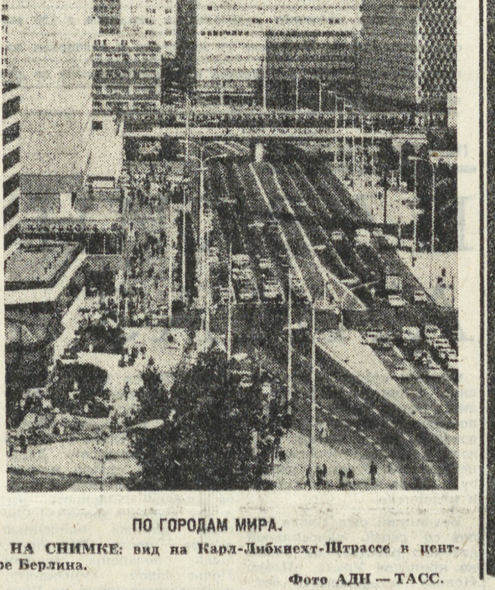
ПО ГОРОДАМ МИРА. НА СНИМКЕ: вид на Карл-Либкнехт-Штрассе в центре Берлина.

Жители столицы охотно посещают Советский культурный центр, где они встречаются со своими соотечественниками, побывавшими в СССР.