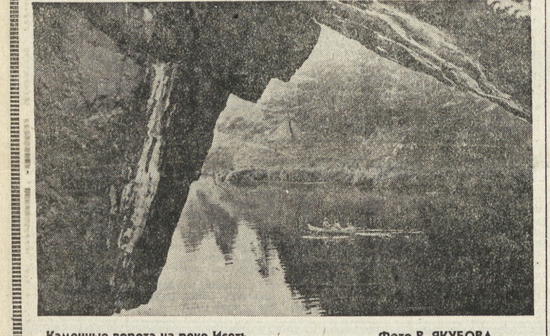
Каменные ворота на реке Исеть.