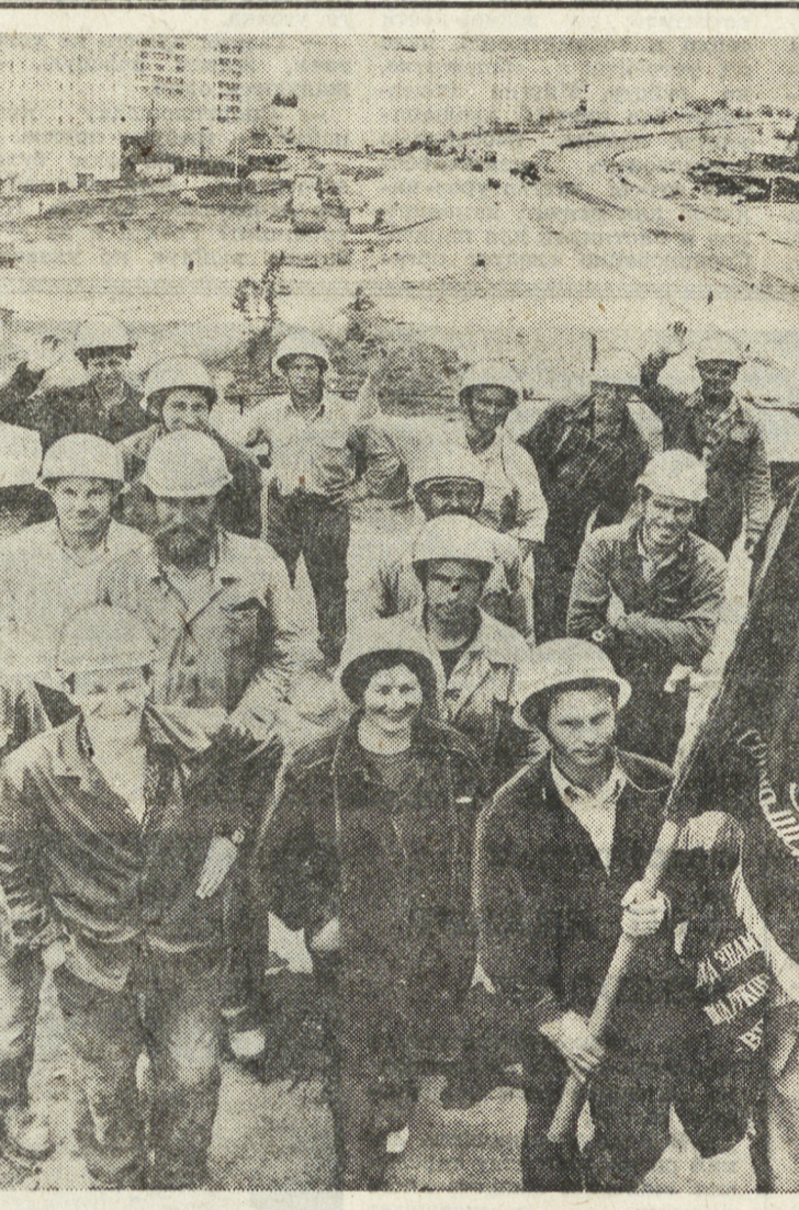
Не по дням, а по часам