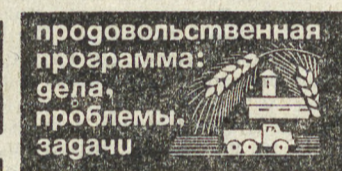
прогосвольственная программа: гела проблемы, задачи