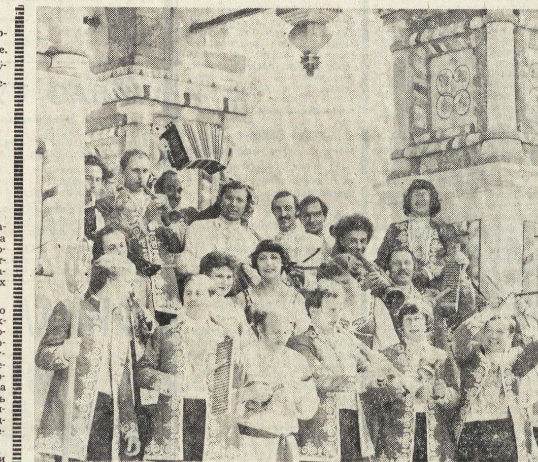
Москва. Лауреат премии Ленинского комсомола ансамбль народных инструментов «Русские узоры» (на снимке) подготовил новую концертную программу, посвященную 60-летию образования СССР и названную «В семье единой».