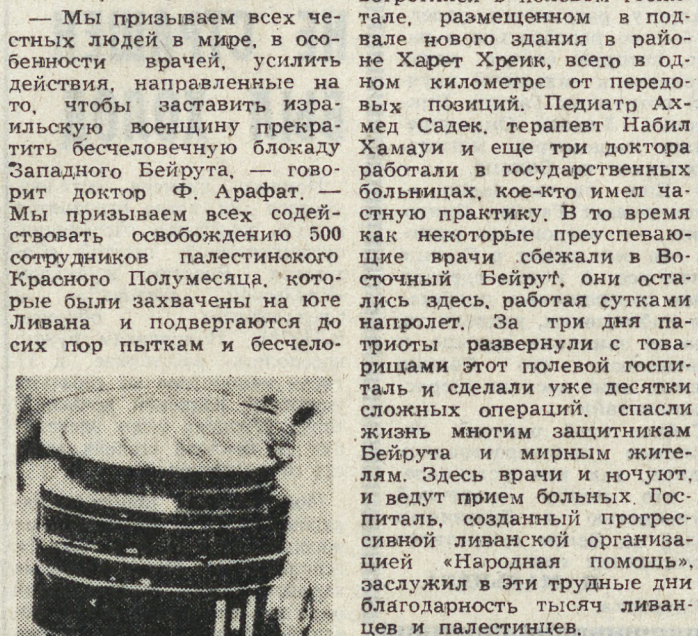
НА СНИМКАХ: 12-летняя Рейма Шамдан, тело которой покрыто страшными ожогами, полученными в результате взрыва фосфорного снаряда; взрывное устройство от ранеты американского производства, выпущенной с израильского военного норабля по району Фахана.