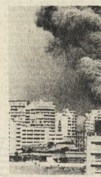
Истерзанная ливанская земля стала ареной ожесточенных кровопролитных боев в агрессию участвуют десятки тысяч израильских военнослужащих, танки и бронетехника, гаицики, военно-морской флот, подразделения десантников. Среди мирного арабского населения имеются многочисленные жертвы. НА СНИМКАХ: во время нападения израильской авиации на Иерусалим.