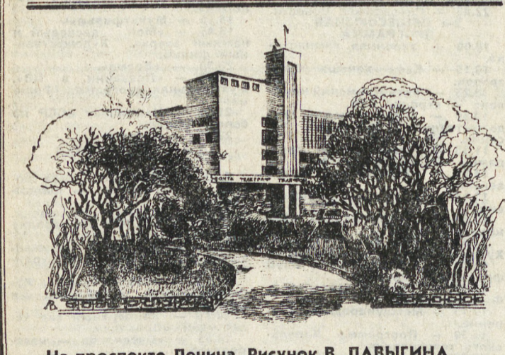
На проспекте Ленина. Рисунок В. ЛАВЫГИНА.