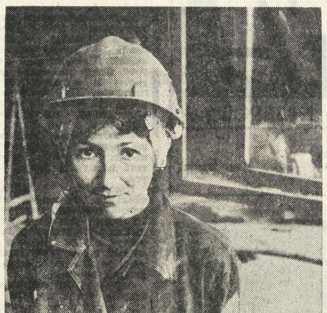
Стройотряд «Радуга» сформирован в Свердловском инженерно-педагогическом институте в этом году. Эта целина для девушек — первая, но они уже добиваются хороших результатов. Студентки штукатурят стены школы, бетонируют полы. А вечером спешат на агитплощадки, поставили уже пятнадцать концертов, прочитали много лекций для жителей Богдановича.