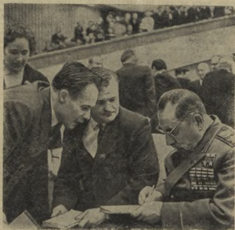
«ПРАВДА КОММУНИЗМА» 2 6 апреля 1966 года

Константин СИМОНОВ, писатель, делегат XXIII съезда КПСС.