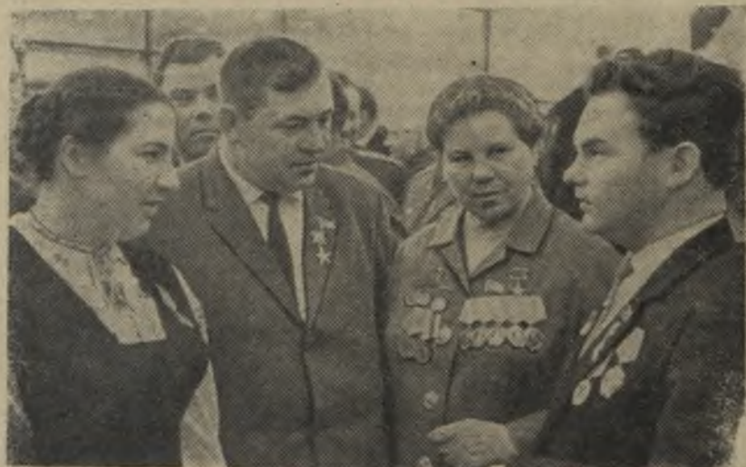
МОСКВА. Кремлевский Дворец съездов. XXIII съезд Коммунистической партии Советского Союза.

Рабочие единодушно одобряют генеральную линию Коммунистической партии в области внутренней и внешней политики.