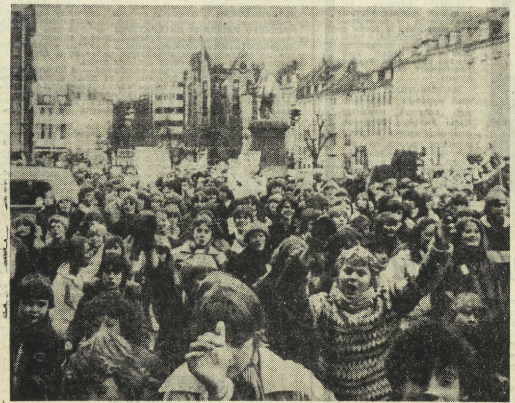
КОПЕНГАГЕН. 60 000 преподавателей и учащихся школ датской столицы провели демонстрацию протеста против политики правительства...