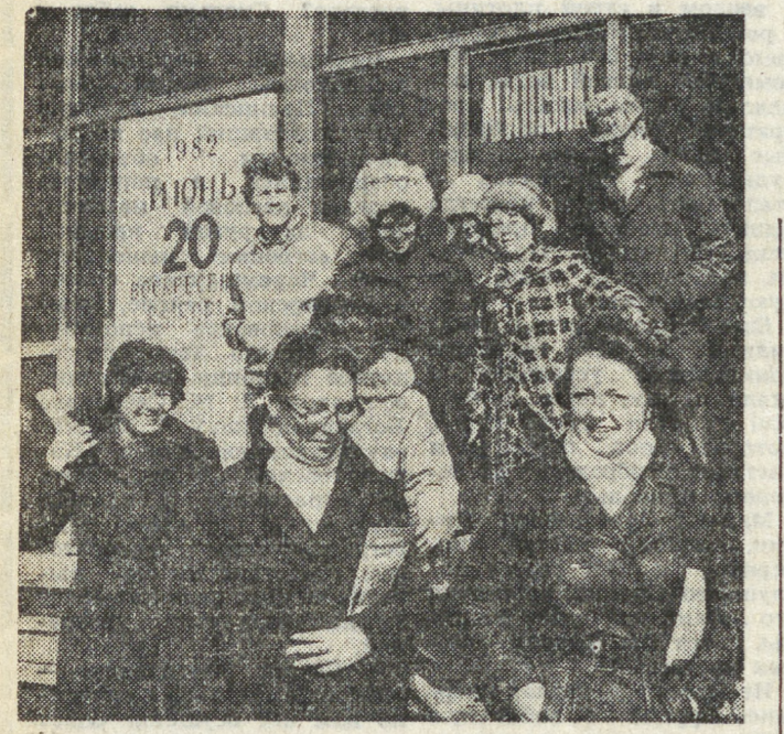
В Ульяновске начали действовать агитационные коллективы. Избирательные округа № 43 и 44 по выборам в городской Совет обслуживают коллектив агитаторов Государственного института по проектированию предприятий легкой промышленности. НА СНИМКЕ: агитаторы, сотрудники института.