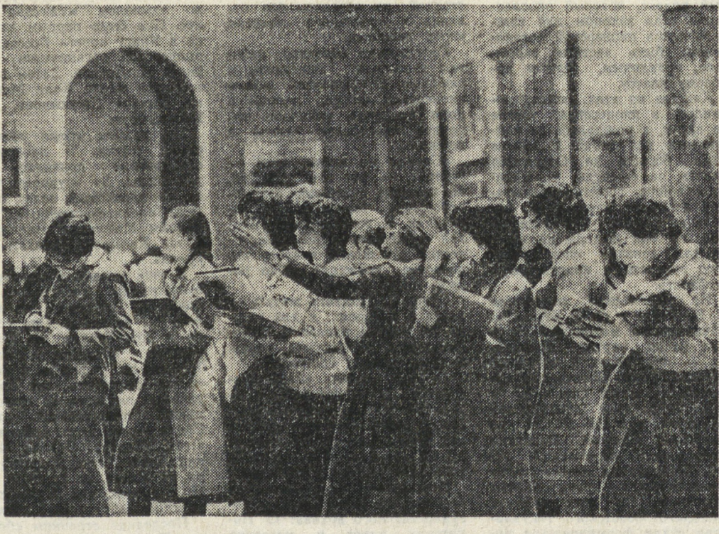
Музей — крупнейший национальный музей Франции, в котором собрана большая коллекция произведений древнеегипетского, античного, западноевропейского искусства. На снимке: в зале Луара.

же с распространением заведомой лжи Меридором — типичный политический трюк, благодаря которому Бегин и К* обеспечили себе поддержку определенного числа избирателей. Что же касается так и «не спасенной экономики» Израиля, то она продолжает хромать. Темпы роста инфляции в стране составили 125 процентов в год. Столь же стремительно растет и дороговизна. Только за первые три месяца нынешнего года цены на основные продукты питания и топливо подскочили почти за 30 процентов. Положение израильских трудящихся ухудшается день ото дня. По данным газеты «Гаарец», сейчас уже более 20 процентов еврейского населения живут ниже официального уровня бедности. Судорожно цепляясь за власть, правительство Бегина на всех перекрестках кричит о своей «заботе о огражденных». Однако на деле оно проводит политику наращивания и без того огромных военных ассигнований при одновременном сокращении расходов на социальные нужды. Д. ЗЕЛЕНИН, (ТАСС).