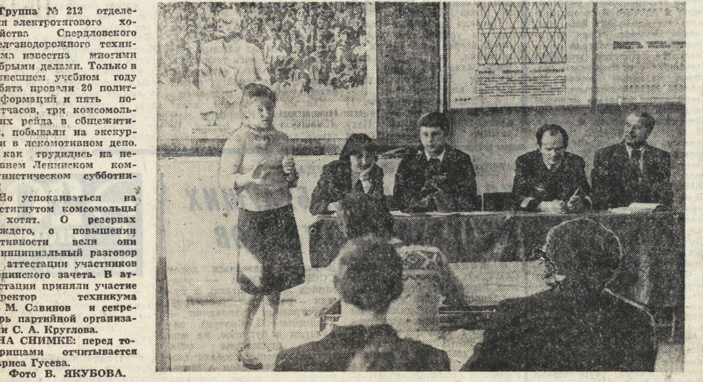
Группа № 213 отделения электротехнического хозяйства Свердловского железнодорожного техникума известна многими добрыми делами. Только в нынешнем учебном году ребята провели 20 политических часов, и пять политических рейдов в общежитиях, побывали на экскурсиях в локомотивном депо...