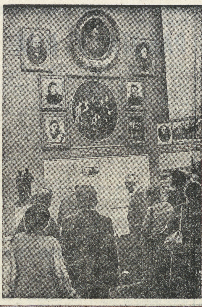
НА СНИМКЕ: гости столицы у стенда «Детство и юность В. И. Ленина».