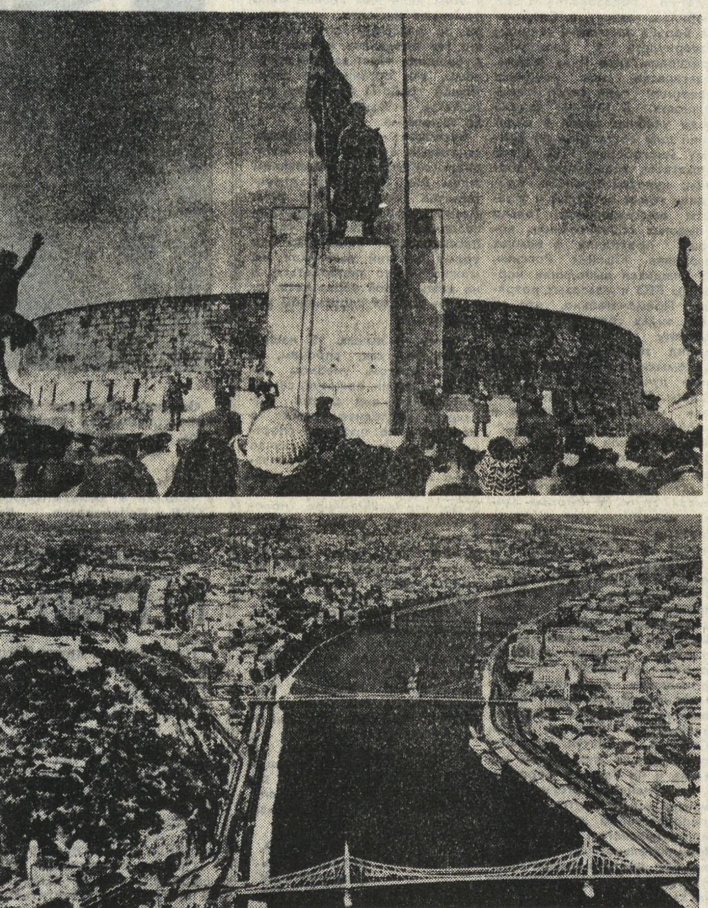
4 апреля — День освобождения Венгрии от фашистских захватчиков. Вид на стелу Венгрии Будапешт.

популярностью и в университете, и в стране. Мы, в свою очередь, стараемся всегда быть «на уровне», пропагандировать идеалы добра и человечности в искусстве, делать наши спектакли актуальными и содержательными. Репертуар театра самый разнообразный. Здесь и древнегреческая «Антигона», и венгерская классика, и произведения современных авторов. Одним из больших успехов театра была композиция по мотивам сказок Андерсена, которую «Скини» много раз показывал и во время зарубежных гастролей. — Со своими спектаклями мы побывали в нескольких странах Европы, в Америке, мы всегда испытывали чувство большой гордости за то, что представляем искусство социалистической страны, — говорит в заключение Альфред Вигман. — Независимыми у нас остались гастроли в Советском Союзе, где нас принимали очень хорошо. А. КУКЛИН, (ТАСС). Будапешт.