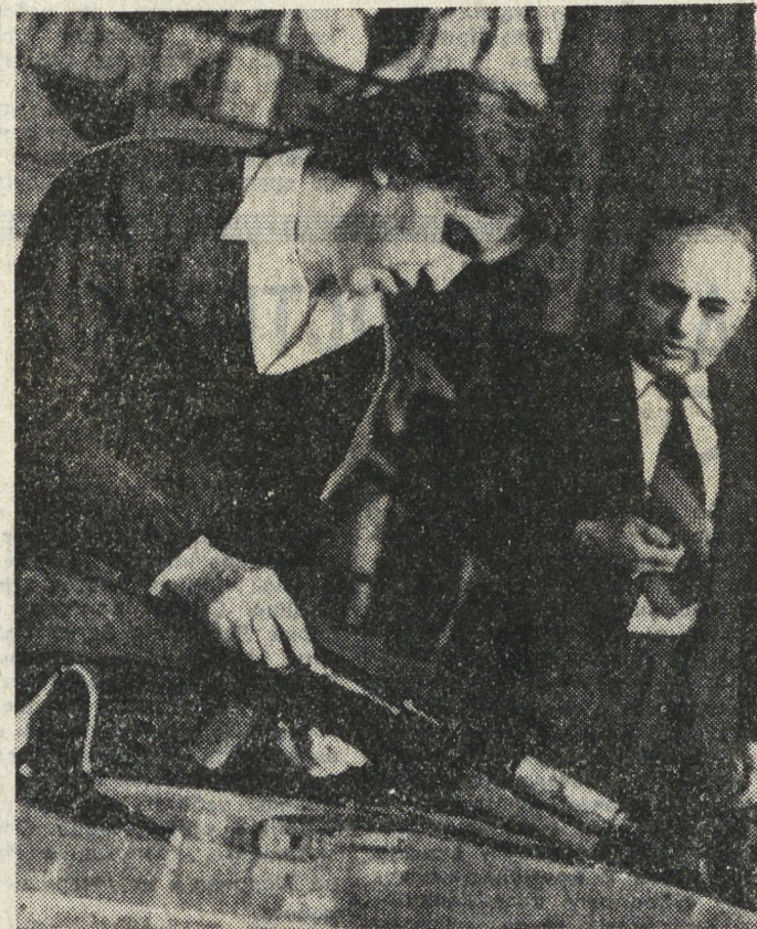
ОТЧИЗНЫ ВЕРНЫМ СЫНОМ БУДЬ!