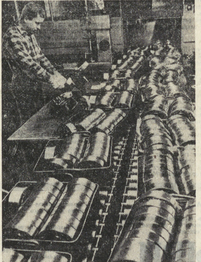
ДНР. Положение в Польше нормализуется. Во всех городах работают промышленные предприятия, действуют городские службы. Восстановлен порядок на улицах и в общественных местах. НА ШИММКЕ: на шарикоподшипниковом заводе в Познани.

Никарагуанская революция, и в этом нет никакого сомнения, сумеет себя защитить. И. НЕМИРА, соб. корр. АПН.