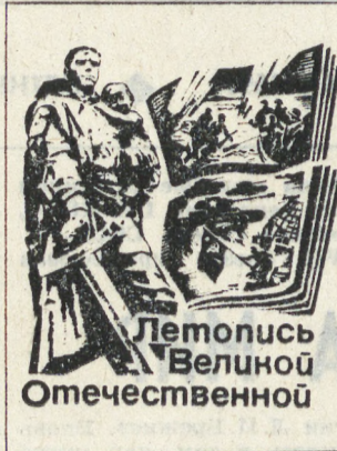
Летопись Великой Отечественной

Чем дальше по времени от нас война, тем пристальнее вглядываемся мы в ее жестокого лида. Вспоминая о прошлом, разсыпав героях, живых и павших, без вести пропавших и семьи погибших, мы одновременно и учимся мужеству, храбрости, доблести, учимся подвигу. Ведь память не только дана прошлому, она и опора настоящего. Из этой немеркнущей памяти мы черпаем силы для новых свершений, получаем вдохновение на самоотверженный труд и новые подвиги.