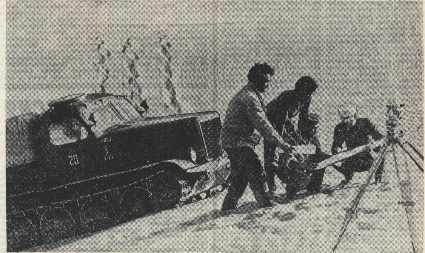
ТУРМЕНСКАЯ ССР. Недалеко от Небит-Дага разведаны запасы йодобромных вод. НА СНИМКЕ: сотрудник Небит-Дагской геологоразведочной экспедиции на новой разведочной площадке в Карану-махе.

СЮЖЕТ ПРОСТ, как кирпич. Рабочий берет в руки тяжелый молот и с могучей силой разбивает гипсолитовое заполнение в дверном проеме стеной перегородки. Осколки сочным дождем брызжут по сторонам. — Не верю! Не верю! — слышимся голосом кричит режиссер. — Еще раз. Камера, дубль два... Рабочий выпирает с лица пот. Поплывав на ладони, он с большим усердием крошет гипсолит. Но режиссер не удовлетворен. И на съемочную площадку, а это стройплощадка, подают еще одну перегородку.