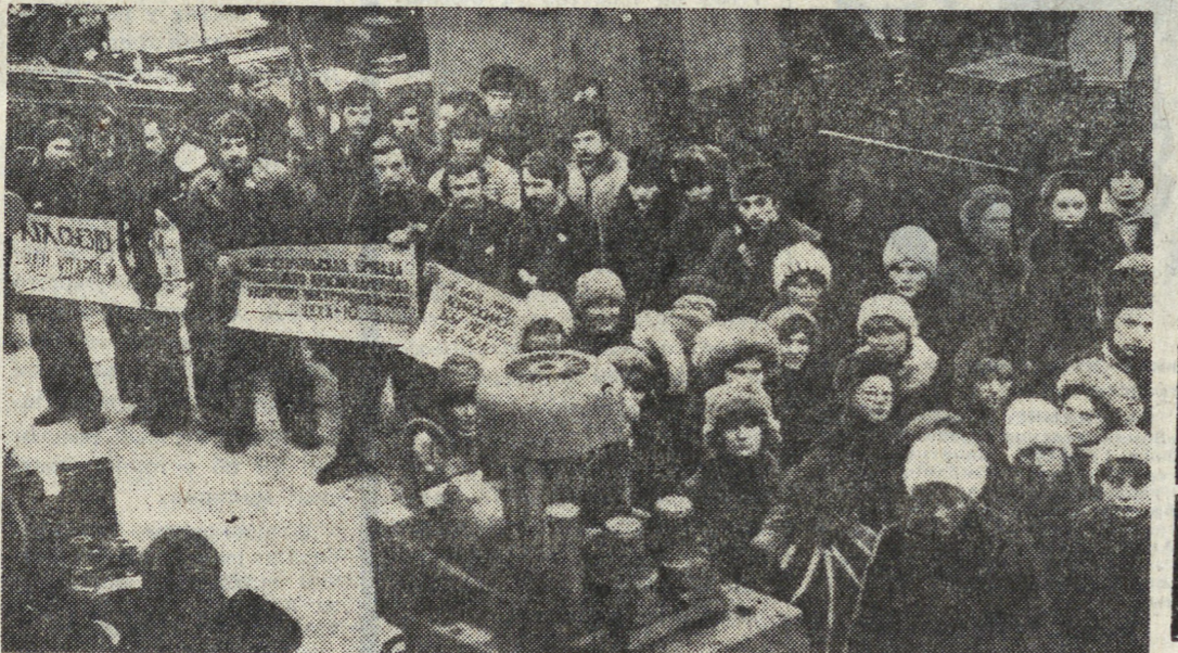
«Рабочие и служащие, все трудящиеся, а также те, кто лишен права на труд, должны выступать единым фронтом против политики консервативного правительства...»