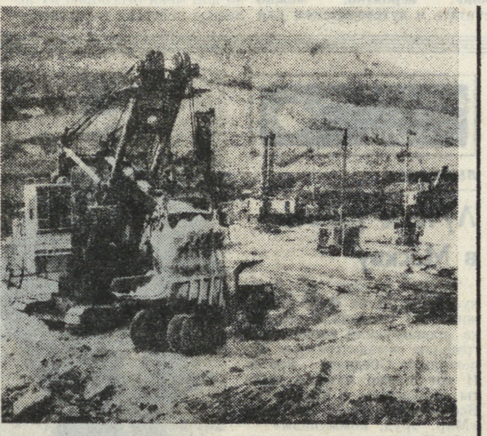
СРВ. В Каошине (провинция Куангбинь) находится крупнейший в стране угольный разрез, построенный при техническом содействии Советского Союза.

ВАСИСТО. В провинции Куангбинь находится крупнейший в стране угольный разрез, построенный при техническом содействии Советского Союза.