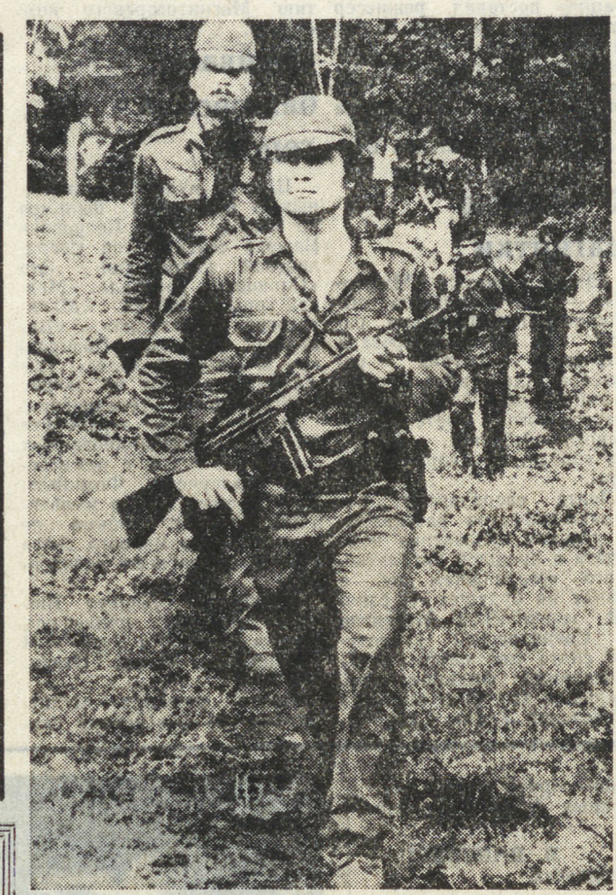
САЛЬВАДОР. В ответ на ужесточившиеся репрессии реакционной хунты бойцы Фронта национального освобождения имени Фарабуо Марти теснее сплачиваются свои ряды в борьбе за свободу, демократию, справедливость.

Сегодня под контролем патриотов находится почти четвертая часть территории страны. Умело используя тактику партизанской борьбы, отряды повстанцев совершают удачные маневры в горных зонах и при активной поддержке местного населения наносят противнику ощутимые удары.