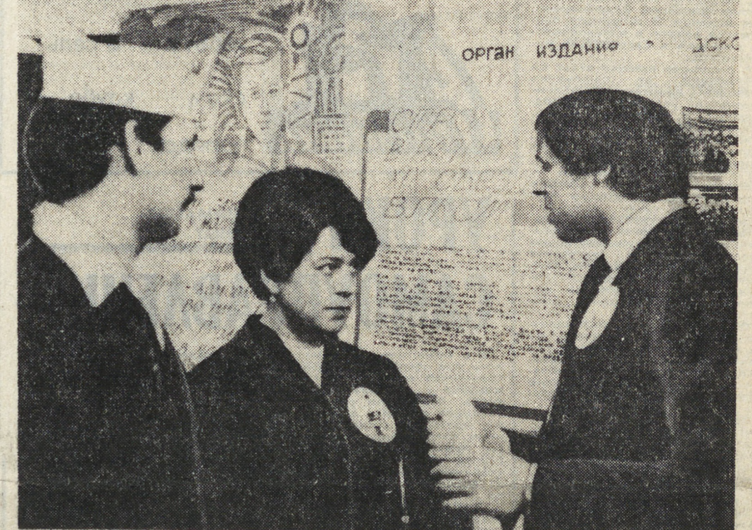
организм издание ДСКС

трубного завода стала инициатором не только районного, но и городского соревнования за право называться комсомольско-молодежным коллективом имени ХХVI съезда КПСС. Сегодня ЦК ВЛКСМ несет это высокое звание. Более двух тысяч молодых рабочих досрочно завершили задания 10-й пятилетки.