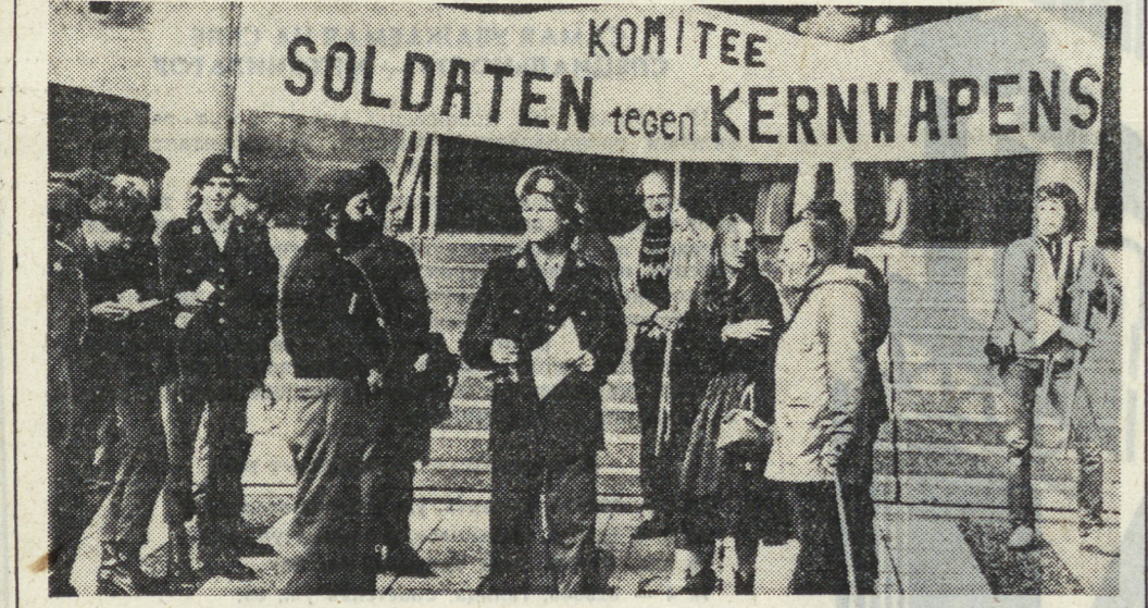
В столице Голландии — Гааге проходит суд над несколькими солдатами, которые отказались охранять склады с ядерным оружием на территории Нидерландов.

Созданная в республике сеть университетов и институтов — предмет особой гордости алжирцев.