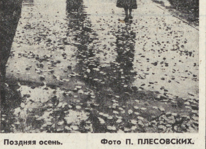
Поздняя осень.

Так пусть же реет он свободно и смело под мирным небом Родины! Пусть ярко горят на груди юных граждан Страны Советов красивые звездочки Октябрят! А. ТАШБУЛАТОВА.