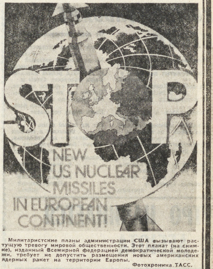
Милитаристские планы администрации США...

удержной гонки стратегических вооружений, для защиты всего человечества.