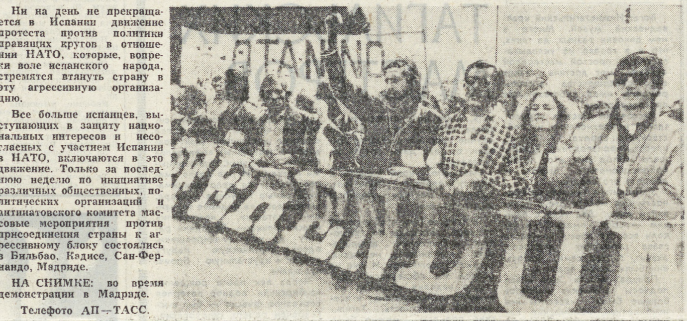
НА СНИМКЕ: во время демонстрации в Мадриде.