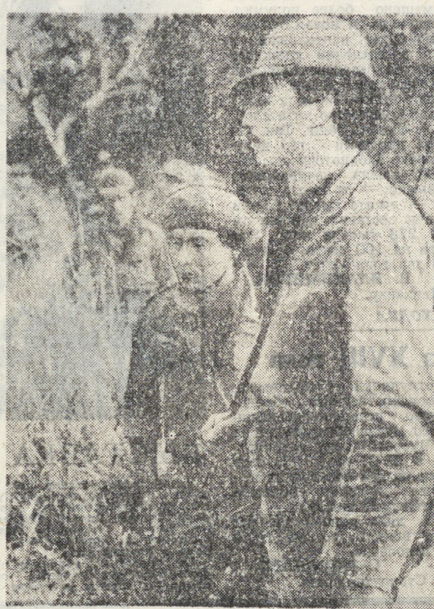
Сдерживая натиск противника, патристические силы Сальвadora берут инициативу в свои руки. Фронт национального освобождения имени Фарабудо Мартин ведет против реакционного режима революционную борьбу, отвергающую итересам и чаяниям широких народных масс. Растущую поддержку оказывает ФНО население страны. Формируются новые отряды для борьбы с пенавильной хунтой. НА СНИМКЕ: бойцы одного из отрядов ФНО.