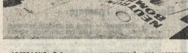
АВСТРАЛИЯ. Собрать миллион подписей под воззванием, принятым на всемирном парламенте народов за мир в Софии, — такую задачу поставил перед собой Австралийский комитет мира.

Улицы и бульвары центра американской кинематографии стали своеобразной зоной военных действий. Создается такое впечатление, будто герои многочисленных «вестернов», которые снимаются в Голливуде, сошли с экранов киноэкранов США и совершают свои «подвиги» в реальной жизни. Практически каждую субботу и воскресенье, сообщает американская газета «Нью-Йорк таймс», в этом районе Лос-Анджелеса возникает переверстка, простирается жестокая погоня, а зачастую и кровавые побоища. Их участники — банды молодых преступников, возраст которых колеблется от 12 до 20 лет. Несмотря на юные годы, они уже успели внести свой «вклад» в общий баланс преступности. «Нью-Йорк таймс» приводит далеко не полный перечень преступлений, совершаемых в период с июня 1980 года по конец июня 1981 года — 43 убийства, 103 изнасилования, 510 вооруженных нападений, 896 краж, 2,452 ограбления, 1,458 случаев угона автомашин и так далее. В целом, подчеркивает газета, число преступлений, совершенных за последние месяцы, возросло в первые пять месяцев нынешнего года на 70 процентов по сравнению с соответствующим периодом