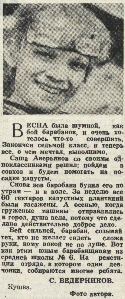
С. ВЕДЕРНИКОВ, Кушва.

ПСКОВ. Ансамбль гуслей «Серебряные струны» выехал сегодня в Германию. Он примет участие в праздновании 32-й годовщины братской страны. Самый молодой профессиональный коллектив области — ему полтора года — уже второй раз приглашен немецкими друзьями. Они