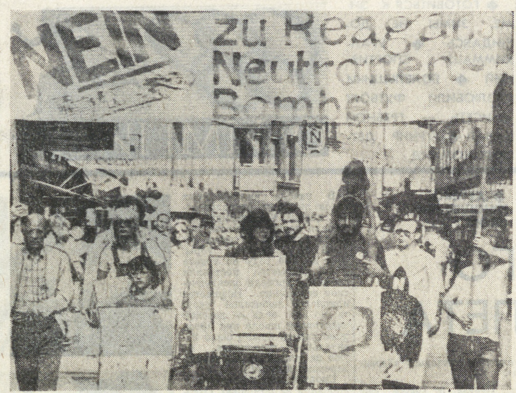
С каждым днем ширится движение западногерманских сторонников мира против размещения на территории их страны новых американских ядерных ракет и нейтронного оружия.

организациями социал-демократической партии города он призывает правительство Федеративной Республики Германия отказаться от размещения нейтронного оружия на территории страны.