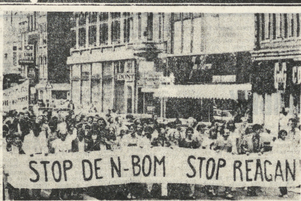
Взрыв негодования прогрессивной общественности вызвало решение администрации Рейгана приступить к полномасштабному производству нейтринного оружия. Участники различных стран мира митингов и манифестаций решительно осуждают этот преступный варварский акт, ведущий к нагнетанию международной напряженности, к усилению угрозы развязывания ядерной войны.