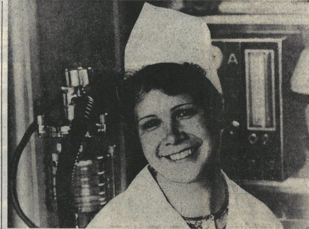
Город в лицах — если бы составить такую мозаику, одной из частичек ее обязательно стал бы этот снимок. Он занял бы достойное место рядом с портретом металлурга, инженера или строителя.

Сейчас во всех городских комсомольских организациях прошло обсуждение принятого недавно обкомом КПСС, облсовета, облкомсомольского комитета и обкомом ВЛКСМ постановления «О проведении областного общественного смотря укрепления трудовой дисциплины и уменьшения потерь рабочего времени». Документ особенно ценится тем, что он предлагает конкретные пути, следуя которым, мы сможем значительно сократить потери рабочего времени. А в этом направлении нам есть над чем поработать.