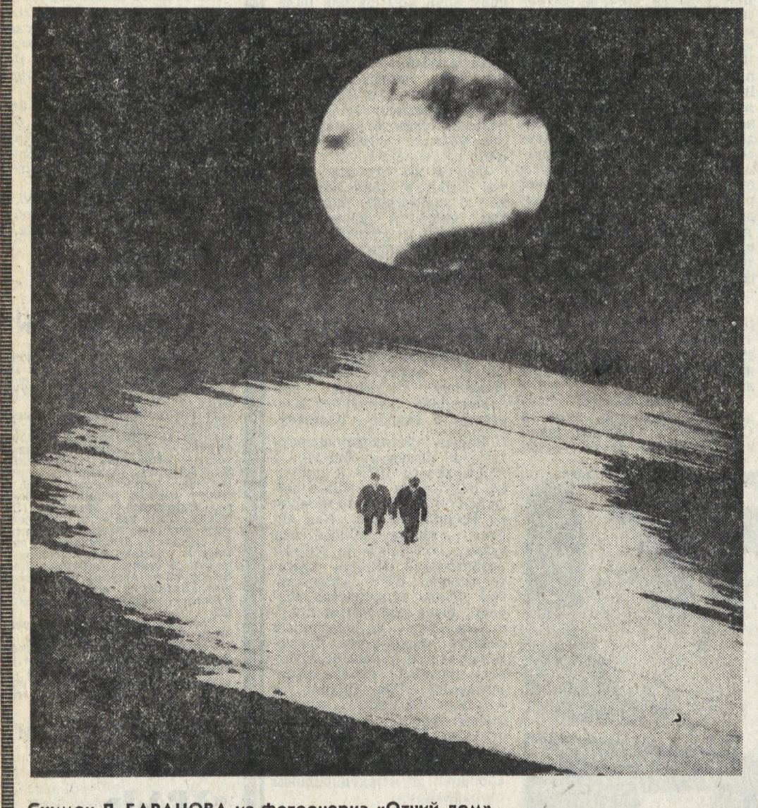
из фоточерка «Отчий дом».