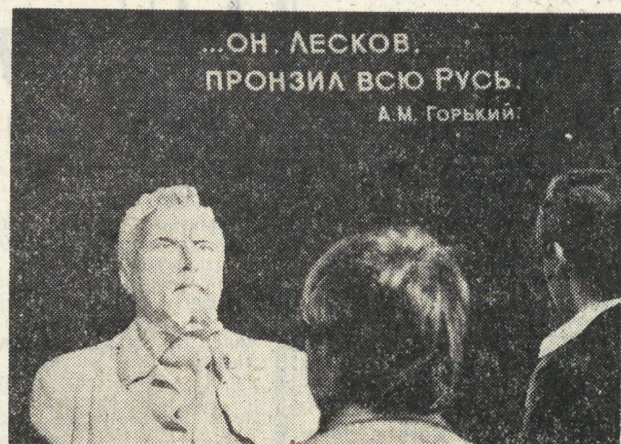
ОН, ЛЕСКОВ, ПРОНИЗЛ ВСЮ РУСЬ. А.М. ГОРЬКИЙ