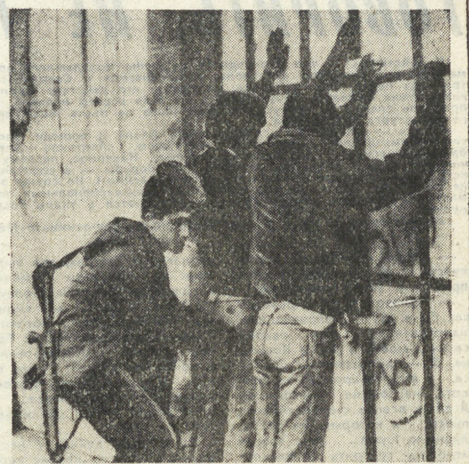
Ближний Восток. Все города и крупные населенные пункты оккупированных Израилем арабских территорий были блокированы армейскими частями захватчиков. На осадим положении оказалось население всех без исключения лагерей палестинских беженцев. Десятки тысяч сбежали переселенных на Западный берег реки Иордан и в сектор Газа каратели перекрыли основные магистрали. На всей территории Западного берега и Газы, объявленной «закрытой военной зоной», действует комендантский час. Доступ в эти районы журналистам и представителям международной общественности категорически запрещен. Такими драконовскими мерами израильские оккупационные власти «встречают» третью годовщину народного палестинского восстания — интифады. НА СНИМКЕ: израильские оккупанты обыскивают арестованных палестинцев.

жидлась критическая ситуация. Антиоппозиционные силы, любой ценой пытающиеся захватить жизненно важные центры города, провалились на территорию телецентра, где завязался бой. На некоторое время были прерваны передачи, участники которых постоянно призывают бухарестцев выйти на улицы, чтобы помочь войскам. Свободное Румынское телевидение передало сообщение о формировании совета Фронта национального спасения, которое возглавил И. Илиеску. В нем говорится, что Румыния переживает исторический момент, открывается новая страница в политической и экономической жизни страны. Цель фронта — утверждение демократии, свободы и достоинства румынского народа. Распускаются все структуры власти клана Чаушеску. Правительство, государственный совет и его институты прекращают свое существование. Вся власть в государстве переходит к совету Фронта национального спасения.