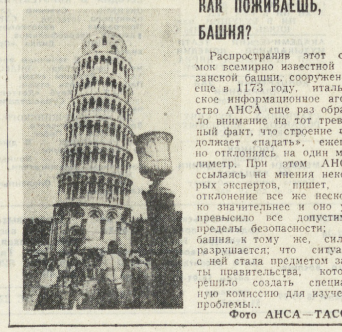
КАК ПОЖИВАЕШЬ, БАШНЯ?