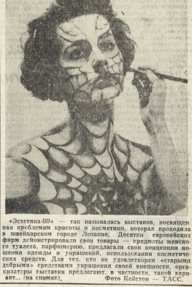
«Эстетика-89» — так называлась выставка, посвященная проблемам красоты и косметики, которая проходила в швейцарском городе Лозанне. Десятки европейских фирм демонстрировали свои товары — предметы женского туалета, парфюмерию, предлагали свои концепции ношения одежды и украшений, использовали косметические средства. Для тех, кто не удовлетворен «старыми добрыми» средствами украшения своей внешности, организаторы выставки предлагают, в частности, такой вариант... (на снимке).