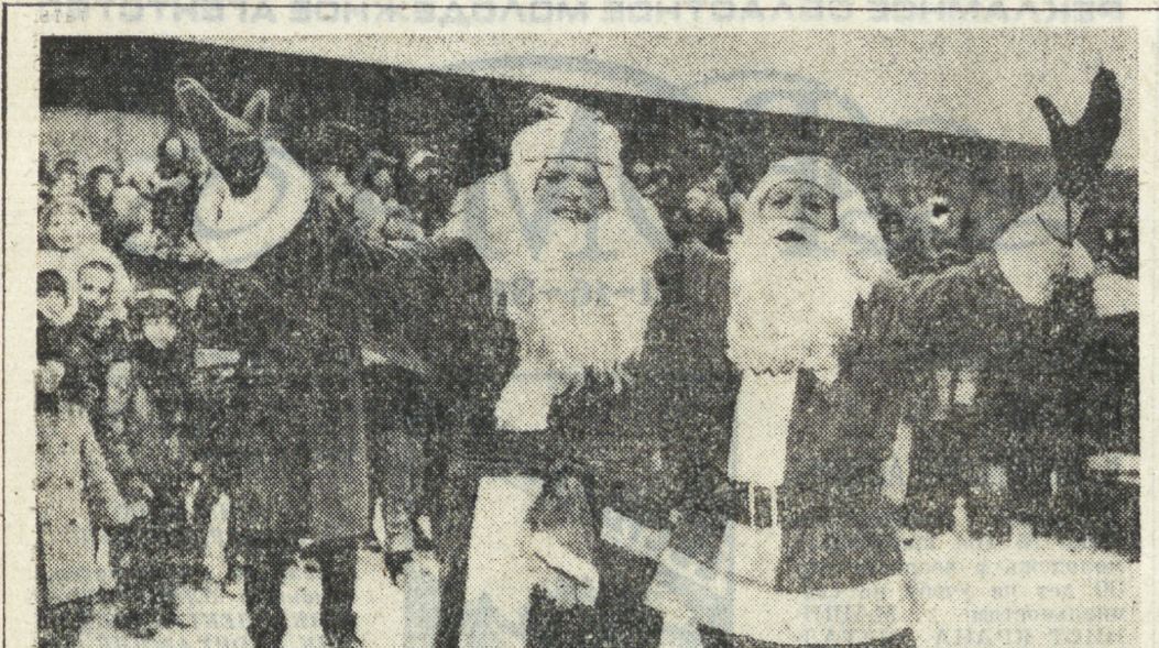
Москва. Приехавшие в нашу столицу 200 Санта-Клаусов из Америки — обыкновенных американцев, людей разного возраста, объединяет искренняя любовь к детям и милосердие. Американские гости привезли юным москвичам письма с добрыми пожеланиями их американских сверстников, традиционные деда-морозовские подарки. НА СНИМКЕ: американский Санта-Клаус и советский Дед Мороз у кинотеатра «Ангара».

Последний в этом году дайджест фактов, событий, комментариев и фотоснимков на основе публикаций советской прессы, сообщений ТАСС посвящен жизни зарубежных стран. Следующая «Панорама»-90 расскажет о нашей стране.