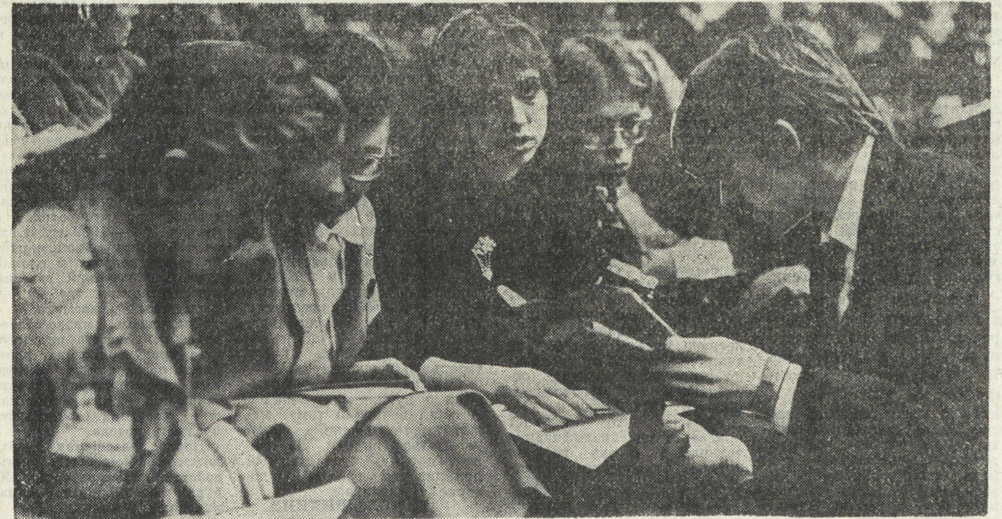
НА СНИМКЕ: в зале московского Дворца молодежи студенты — делегаты из Свердловска.