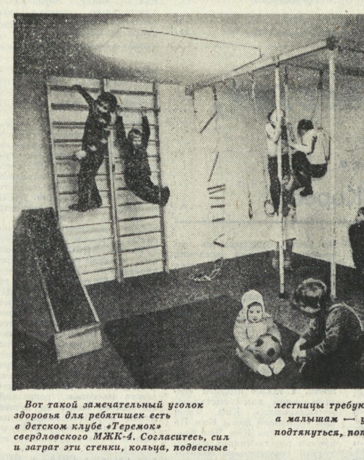
Вот такой замечательный уголок здоровья для ребятшек есть в детском клубе «Теремок» свердловского МКЖ-А. Согласитесь, сил и затрат эти стенки, кольца, подвесные лестницы требуют минимальных, а малышам — удовольствие: ползать, подтягиваться, попрыгать...

Вот такой замечательный уголок здоровья для ребятшек есть в детском клубе «Теремок» свердловского МКЖ-А.