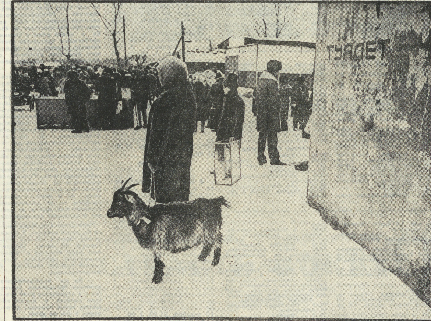
«Ну-ка, где тут у нас бабы?»