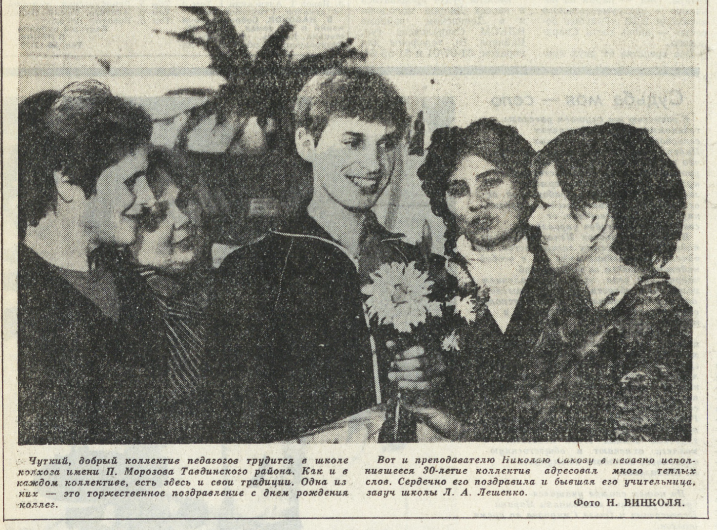
Чуткий, добрый коллектив педагогов трудится в школе колхоза имени П. Морозова Таевоинского района...