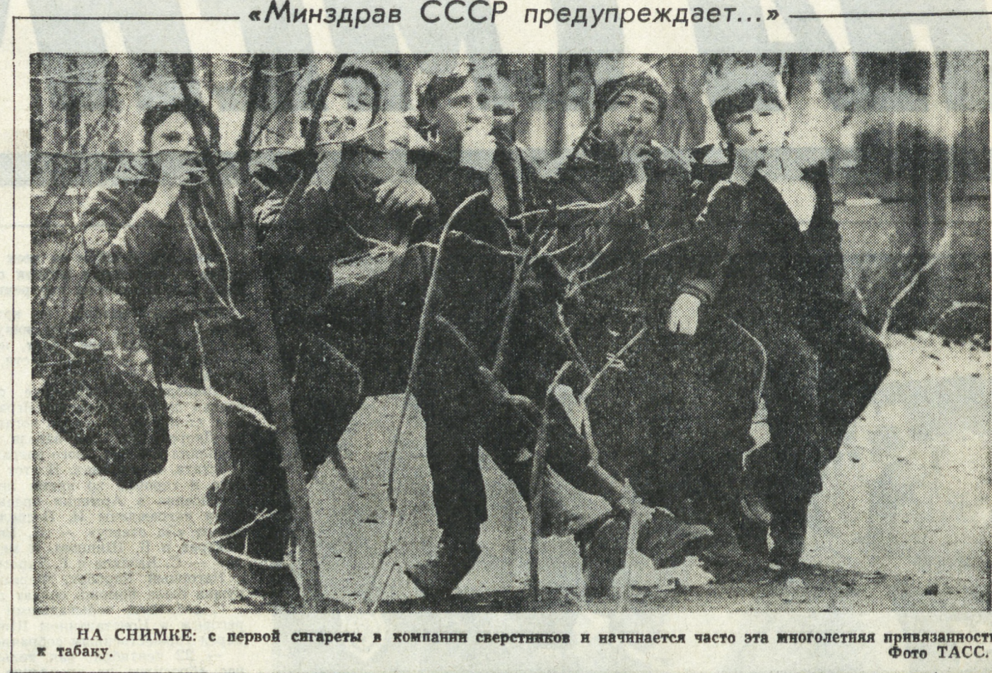
НА СНИМКЕ: с первой сигареты в компании сверстников и начинается часто эта многолетняя привычка к табаку.

Государство не может выполнять свои функции в условиях нестабильного право-