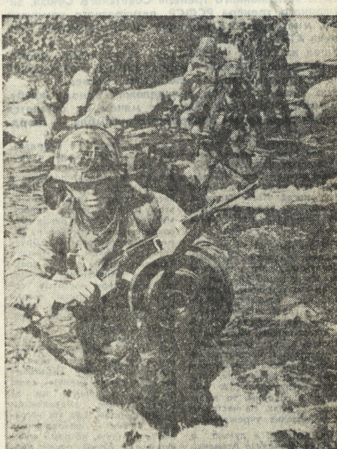
НА СНИМКЕ: Военнослужащие США продолжают водить учения в ходе учений на территории ФРГ.

Да, «красные» еще остаются противником на учениях вооруженных сил бундес-