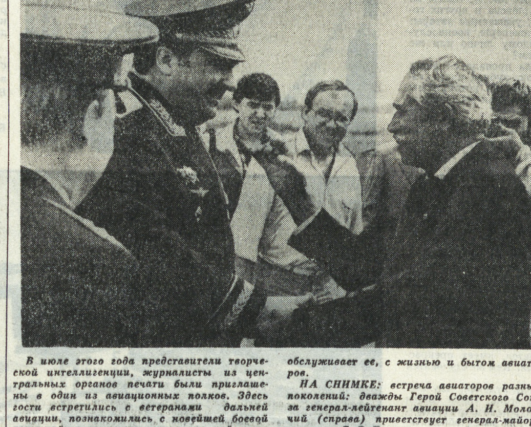
В июле этого года представители творческой интеллигенции, журналисты из центральных органов печати были приглашены в один из авиационных полков...