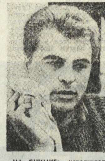
НА СНИМКЕ: исполнитель главной роли Микеле Плачидо.