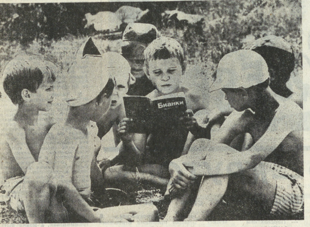
«Книжкино» время.