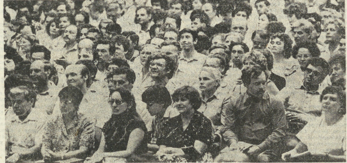
Новая рубрика: депутатская площадь