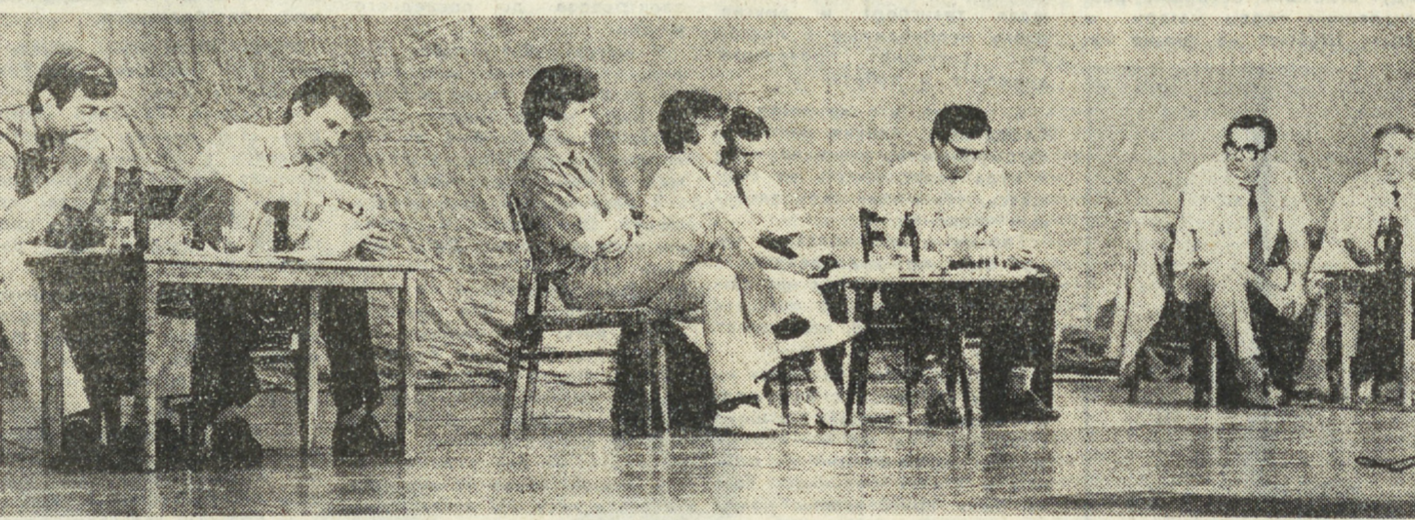
Мост, перекинутый незримо из свердловских квартир в номера гостиницы «Россия», где жили земляки — депутаты.